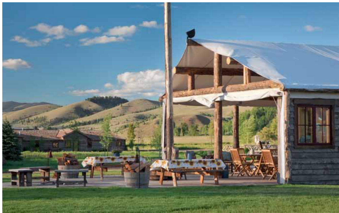
Auf der Ranch at Rock Creek gibt es neben dem Tontauben-Schießstand viele gemütliche Plätze, wo sich die Gäste treffen, um ein wenig „Cowboy-Latein“ zu spinnen.

Room, dem Restaurant, dem Spa und dem Silver Dollar Saloon. Direkt hinter dem Saloon befindet sich der rustikale Pool, wo sich die Gäste nach einem heißen Tag auf der Ranch abkühlen können. Der rechteckige Pool wird flankiert von erdfarbenen Flintsteinen, daneben gibt es Chaise Lounges, einen heißen Whirlpool, eine Sitzcke sowie eine Feuerstelle.