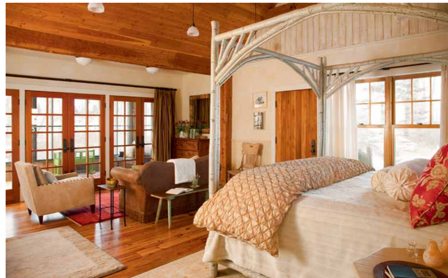
Die Zimmer und Suiten spiegeln die rustikale Eleganz herrschaftlicher Landhäuser wider.

verfügen über den modernen Komfort eines Fünf-Sterne-Resorts. Die Unterkünfte in The Lodge erinnern an alte Railway Station Hotels und eignen sich hervorragend für Hochzeitsgruppen oder große Familien, die für eine Zeitlang der Mittelpunkt des Ranchlebens sein wollen. Das Trapperzelt ist mit Abstand die einzigartigste und ungewöhnlichste Übernachtungsmöglichkeit in der Ranch at Rock Creek und eignet sich ideal für verliebte Paare, die gerne ungestört bleiben. Vom weitläufigen Schlafzimmer unter Zeltplanen führt ein überdachter Pfad hinüber zum kleinen Blockhäuschen mit Küche und großem Badezimmer, wo Steinfliesen