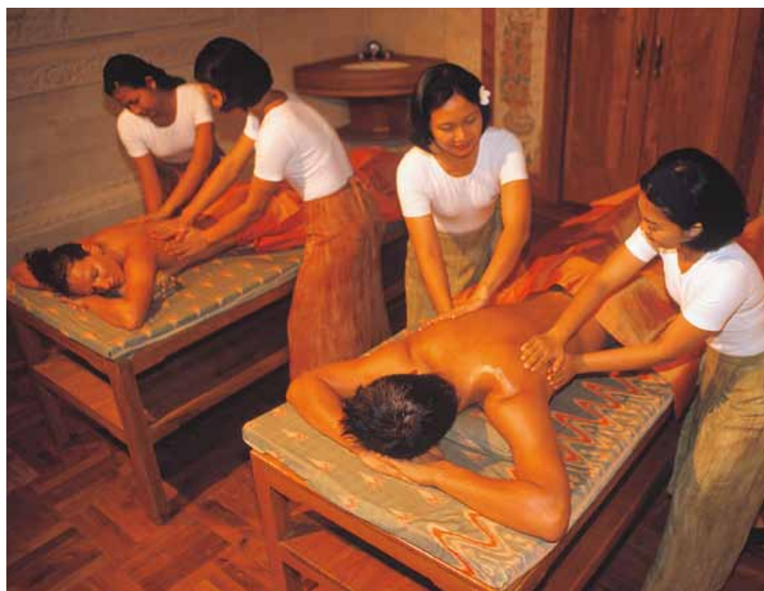
Krönender Höhepunkt jeder Beautybehandlung: eine vierhändige Massage.

den exklusiv für den Parwathi Spa des Matahari Beach Resort entwickelt und sind die Krönung eines einmaligen Wellness-Konzeptes, bei dem der Mensch als Ganzes mit all seinen persönlichen Empfindungen und Bedürfnissen im Mittelpunkt steht. Für die „Reise nach innen“ und natürlich für die äußere Schönheit kann sich jeder Gast sein ganz individuelles „Wellness-Menü“ zusammenstellen. Doch so unterschiedlich die Treatments, für die ausschließlich wertvolle Essenzen und exklusive Naturkosmetik verwendet werden, auch sein mögen, in der fast mystischen Atmosphäre des wunderschönen Spas, dessen Architektur den königlichen Wasserpalästen Balis nachempfunden ist, rückt der Alltag mit jeder Minute weiter in den Hintergrund.