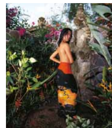
Unter freiem Himmel wird das Duschen zu einem unvergeßlichen Erlebnis.