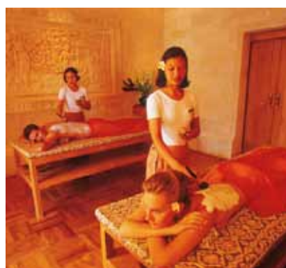
Kostbare Aromen ätherischer Öle unterstützen die Wirkung der individuell zusammengestellten Körpermasken und -peelings.