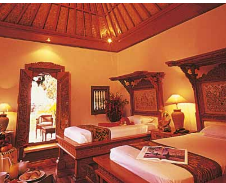
Die Bungalows bestechen durch eine geschmackvolle Harmonie von Farben und Formen.